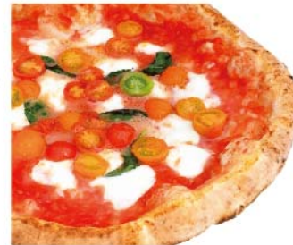
マルゲリータ エクストラ Margherita extra トマトソース・チェリートマト・水牛のモッツァレラ・バジリコ