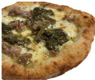
サルシッチャ フリリエッリ Salsiccia e friarielli モッツァレラ・サルシッチャ(自家製ソーセージ)・フリリエッリ・グランマーソース