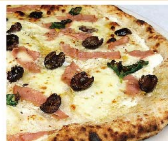
プルチネッラ Pulcinella モッツァレラ・リコッタチーズ・ハム・オリーブ・バジリコ