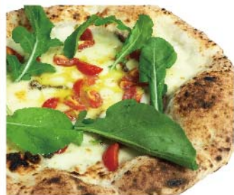
アッチューゲ エプロヴォラ Acciughe e provola 燻製モッツァレラ・アンチョビ・チェリートマト・ルーコラ