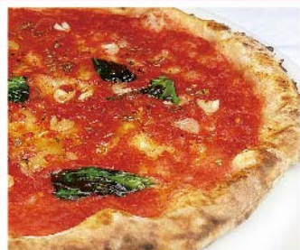
マリナーラ Marinara トマトソース・ニンニク・オレガノ・バジリコ