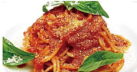
スパゲッティ シンプルなトマトソース“ポモドーロ” Spaghetti al pomodoro ¥1,410(税込)