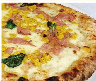
ミモザ Mimosa モッツァレラ・生クリーム・コーン・ハム・バジリコ