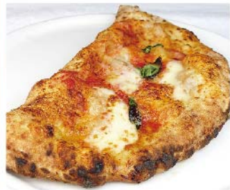
カルツォーネ Calzone トマトソース・モッツァレラ・リコッタチーズ・ハム・バジリコ・黒胡椒