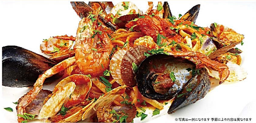
リングイネ 海の幸たっぷりのトマトソース Linguine alla pescatora ¥2,380(税込)