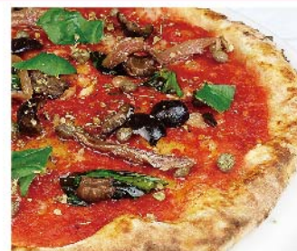
シチリアーナ Siciliana トマトソース・チェリートマト・ニンニク・オリーブ・ケッパー・アンチョビ・オレガノ・バジリコ