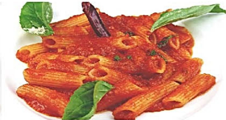
ペネリガーテ ピリ辛トマトソース“アッラピアータ” Penne rigate all'abbiat ¥1,410(税込)