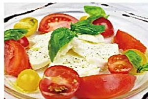
カンパーニャ州水牛モッツアレラと 辻さんチェリートマト“カプレーゼ” Caprese ¥1,410(税込)