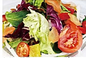
伊勢原野菜のミックスサラダ Insalata ¥980(税込)