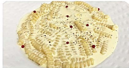
フジリ 4種類のチーズクリームソース Fusilli Quattroformaggi ¥1,620(税込)