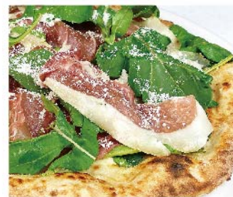
プロシュット エルーコラ Prosciutto e rucola モッツァレラ・生ハム・ルーコラ