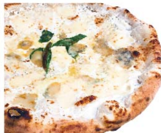
クアットロ フォルマッジ Quattro formaggi イタリア産4種のチーズ