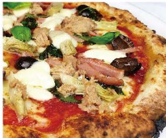
カプリチオーザ Capricciosa トマトソース・モッツァレラ・ハム・オリーブ・ツナ・バジリコ