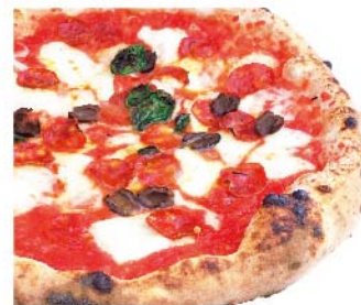
ディアヴォラ Diavola トマトソース・モッツァレラ・辛肉サラミ・オリーブ・バジリコ