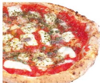
ナポリ Napoli トマトソース・モッツァレラ・アンチョビ・オレガノ・ケッパー