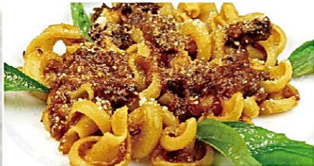
ヴェスヴィオ 牛スネ肉のトマト煮込み ラグーナボレターナ和え Vestuvio al ragu napoletano ¥1,730(税込)