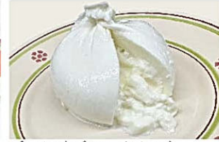
プーリア産ブルラータチーズ Burrata Pugliese 数量限定! 120g/¥1,800(税込) (賞味期限が短い商品ですので、賞味期限が経過した当日になるものも含まれますので、ご了承ください)