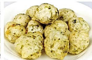
ナポリ名物生海苔入り揚げパン “ゼッポリーネ” Zeppoline ¥650(税込)