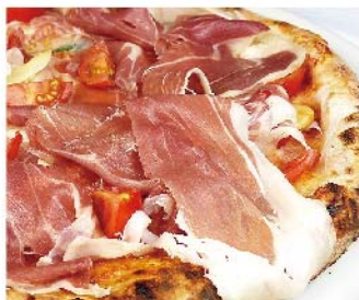
レディナポリ Re di napoli 燻製モッツァレラ・生ハム・チェリートマト・バジリコ