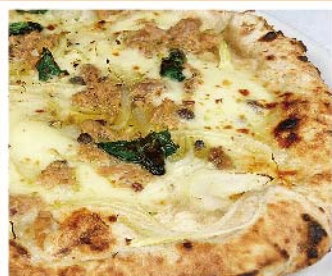
プリエーゼ Pugliese モッツァレラ・ツナ・玉ネギ・ケッパー・バジリコ・黒胡椒