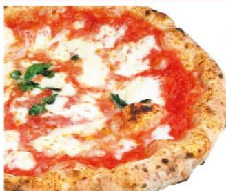
マルゲリータ Margherita トマトソース・モッツァレラ・バジリコ