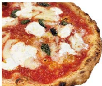
マルゲリータ コンリコッタ Margherita con ricotta トマトソース・モッツァレラ・バジリコ・リコッタ